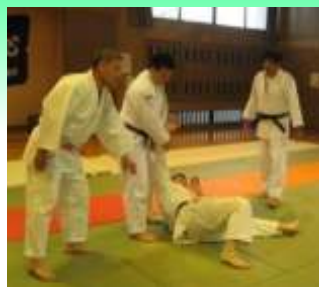
指導者による研修会の様子

本市では、指導者研修会を実施し安全に配慮した武道(柔道)の授業づくりに取り組んでいます。