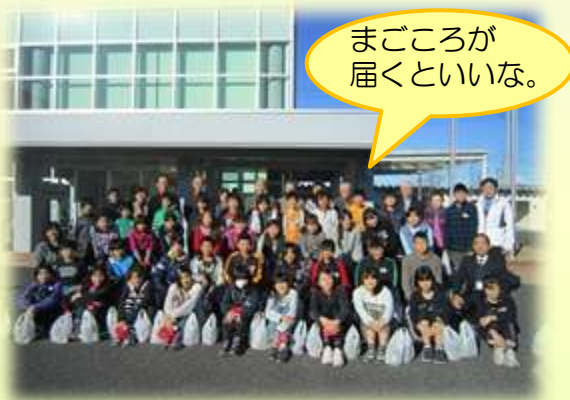
公民館前で記念撮影 (明戸地区)