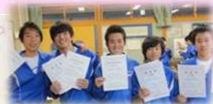
認定証をもらい喜ぶ生徒（豊里中）