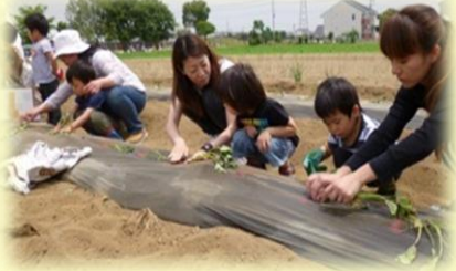
さつまいもの苗植え