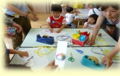
かたつむり作り (製作)