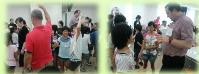
昨年度の「夏休み子ども英会話体験教室」の様子