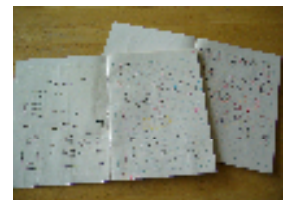
< 算数の学習の仕方 > < ノート記録 >