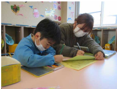
(親子アルバム作り)

14日（金）親子でアルバム作りを行いました。本園では、幼稚園生活の思い出を残そうと親子で手作りアルバムを作っています。PTA保健体育部の皆さんに細かな準備をしていただき、当日を迎えました。相談しながら仲良く制作する姿がありました。