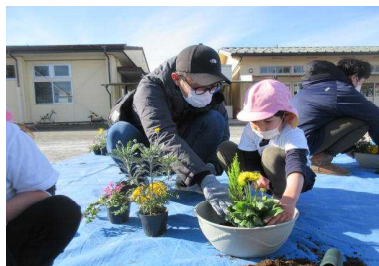
(親子キッズガーデニング教室)

19日（水）親子で寄せ植えの体験を行いました。JAふかやの方と深谷市花き生産組合の方にお世話になり、お花にふれあい、親しみ、楽しむ「花育」を体験することができました。