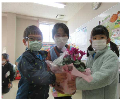
(給食センター訪問)

18日（火）深谷市立花園学校給食センターの見学に行ってきました。1月24日から30日までを「全国学校給食週間」として、郷土料理や昔の献立・姉妹都市の献立を楽しむことができます。たくさんの野菜を黙々と切る姿を拝見し、子供たちの心にあらためて感謝の心が芽生えたことと思います。調理員さんのご苦労と食の大切さを実感するひとときとなりました。